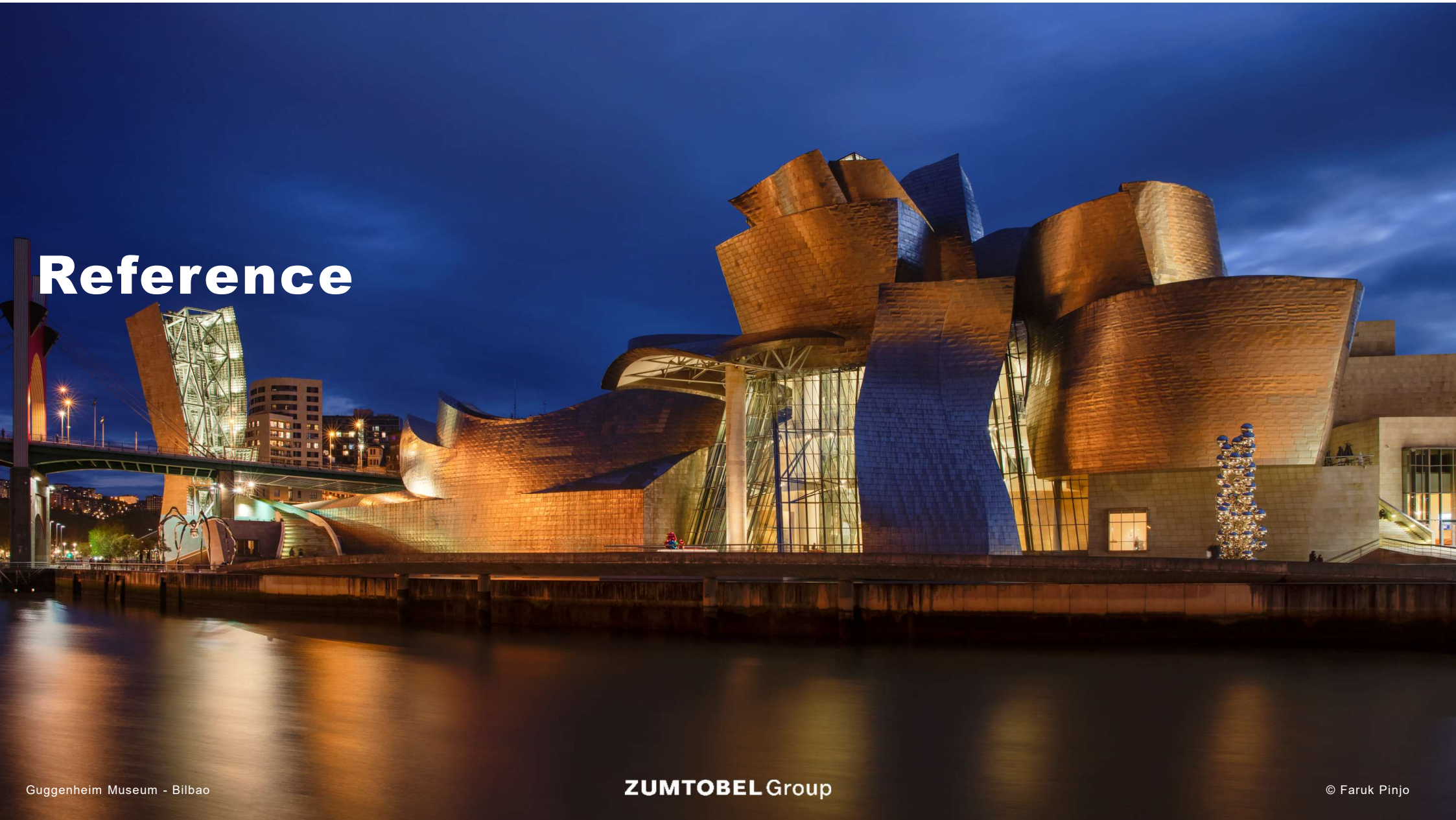
Guggenheim Museum - Bilbao