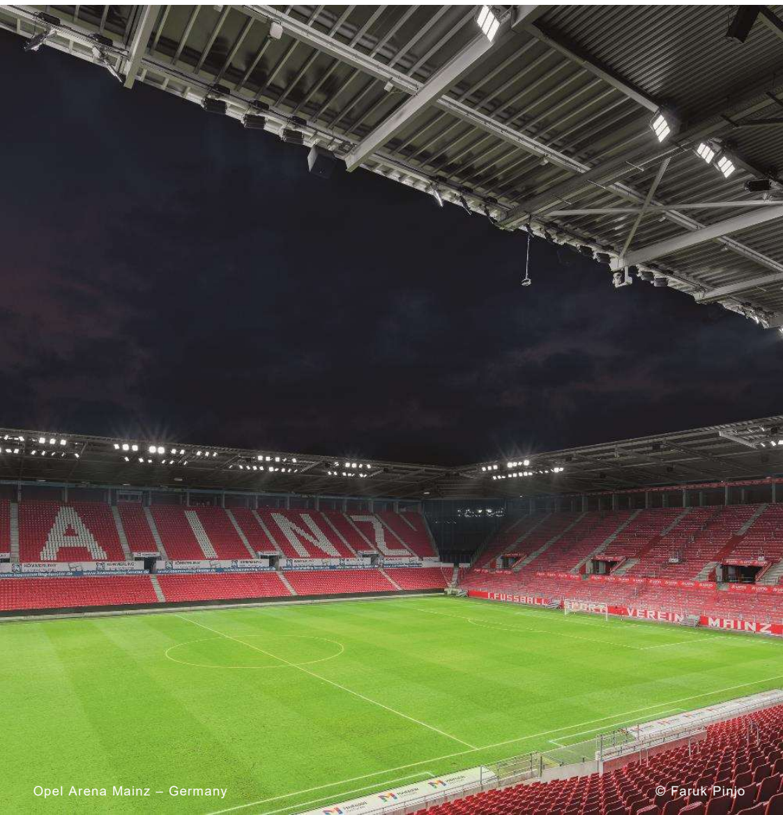
Opel Arena Mainz – Germany